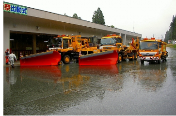
整列する除雪車輛

今シーズンも安全には十分気をつけて除雪作業を実施しますので、皆様のご理解・ご協力のほど、よろしくお願い致します。