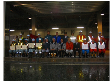
除雪従事功労者受賞者の皆様

長年にわたり除雪作業の第一線で、日夜を問わず活躍されている方々の功績を讃え、出動式にて除雪従事功労者の表彰を行いました。これからも健康に気をつけていただき、除雪作業にご尽力いただきたいと思います。