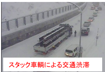
スタック車輛による交通渋滞

出張所としても道路情報板等で情報提供を行うと共に、降雪初期は夏タイヤでの通行不可の呼びかけも行っておりますが、夏タイヤで通過しようとしてUターンされるドライバーもおられます。Uターンし別経路で目的地へ向かう場合、ドライバーにとっても時間のロスとなりますので、早めのタイヤ交換及びチェーンの準備・装着をお願いします。