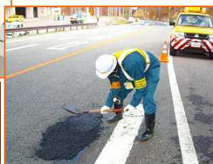
応急処置のようす