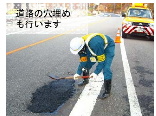
道路の穴埋めも行います