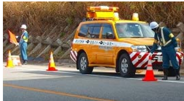
【パトロール実施状況】

連絡先：道路緊急ダイヤル #9910 月山道路情報ターミナル 0235-57-5016 月山国道維持出張所 0235-57-5011