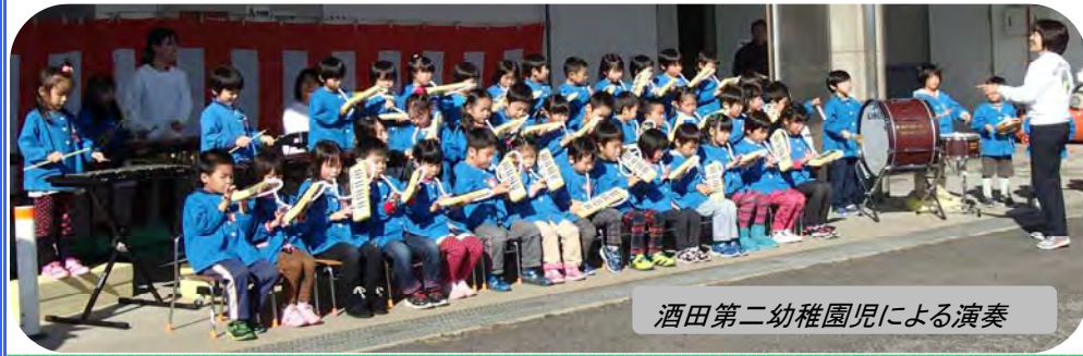
酒田第二幼稚園児による演奏