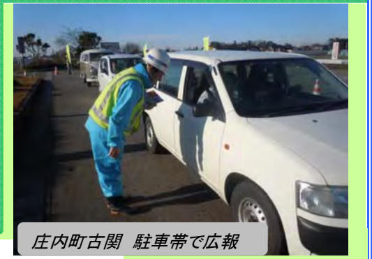
庄内町古閑 駐車帯で広報

また、出動式終了後、国道47号の庄内町古閑駐車帯で冬タイヤの早期装着を呼びかける運動及び冬タイヤ装着調査を実施しました。