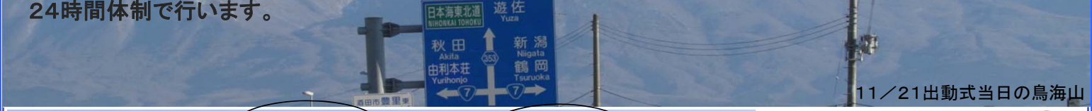
11/21出動式当日の鳥海山

酒田第二幼稚園児による楽器による演奏を合図に除雪機械が出発し、その後、園児による除雪車試乗体験を行いました。国道7号・47号の除雪作業は、酒田と余目除雪ステーションの2箇所に除雪車17台を配備し、安全・安心な冬道確保のため、24時間体制で行います。