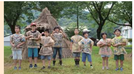
竪穴式住居と縄文衣装を着た子どもたち

東成瀬村には、旧石器時代から近世までの遺跡があります。縄文時代の遺跡(上捨遺跡)で発見された日本最大級の大型磨製石斧の石材は、400キロも離れた北海道日高山脈中部の河川上流でしか採れないアオトラ石と鑑定されました。縄文期の交易の広さを物語る貴重な石斧で、昭和63年に国の重要文化財に指定されています。