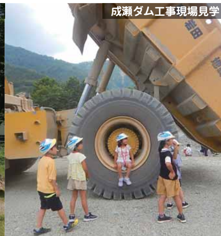
成瀬ダム工事現場見学