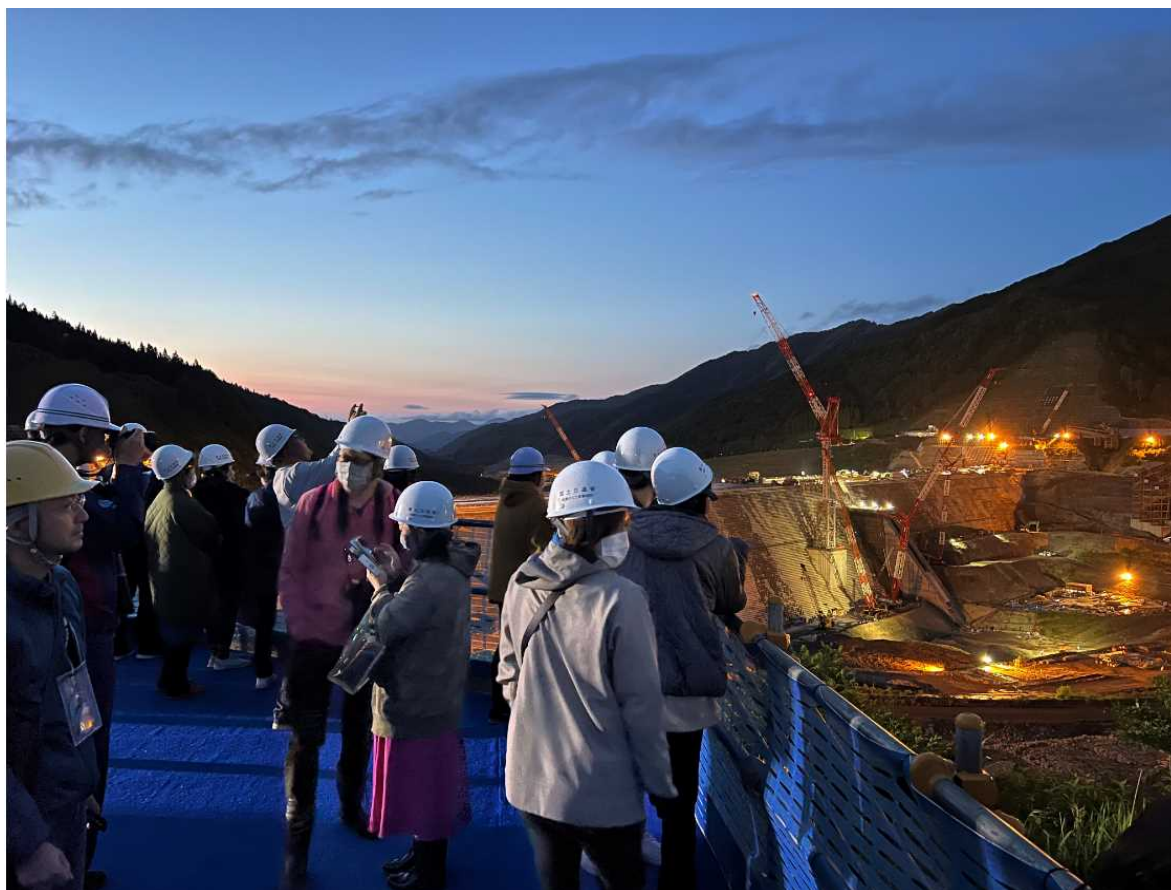
(参考) 令和6年度 夜の現場鑑賞会の様子 (5月29日)