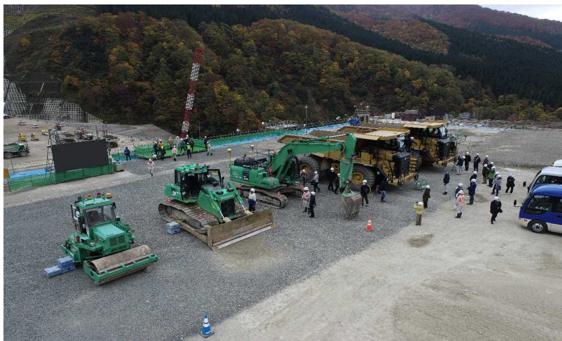
大型重機とのふれあいコーナー