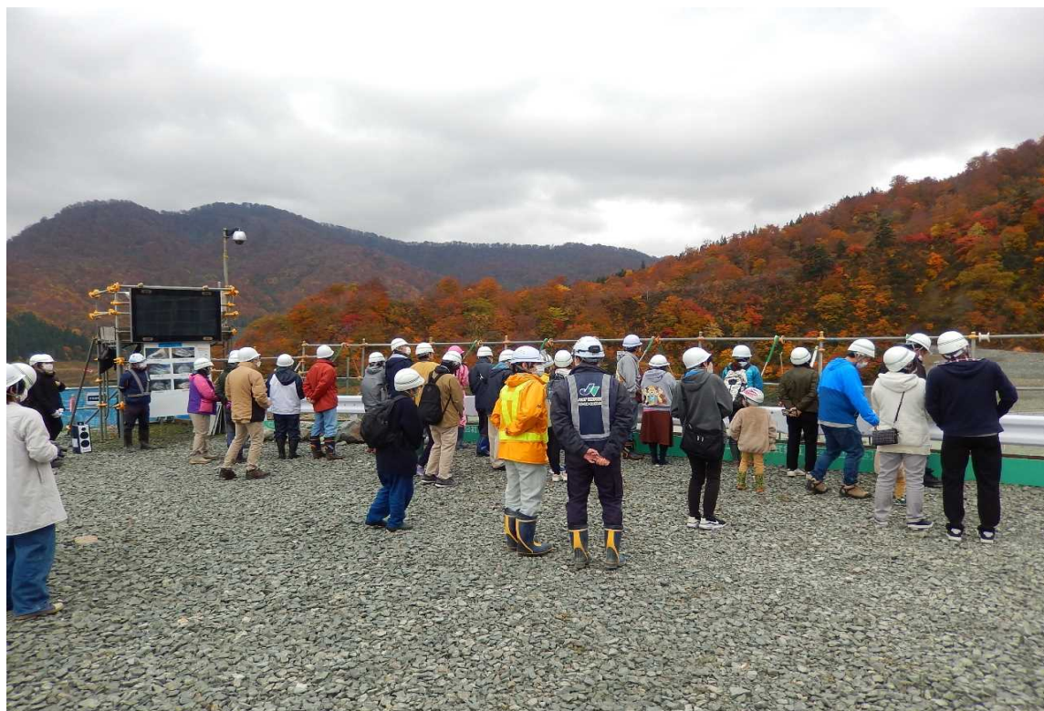
原石山展望台(岩石採取作業の見学)