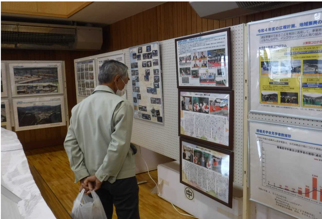
成瀬ダム展(東成瀬村村民体育館)