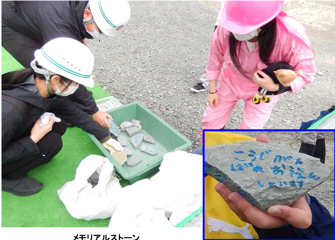
メモリアルストーン この岩石は、砕かれること無くそのままダム材料となります。