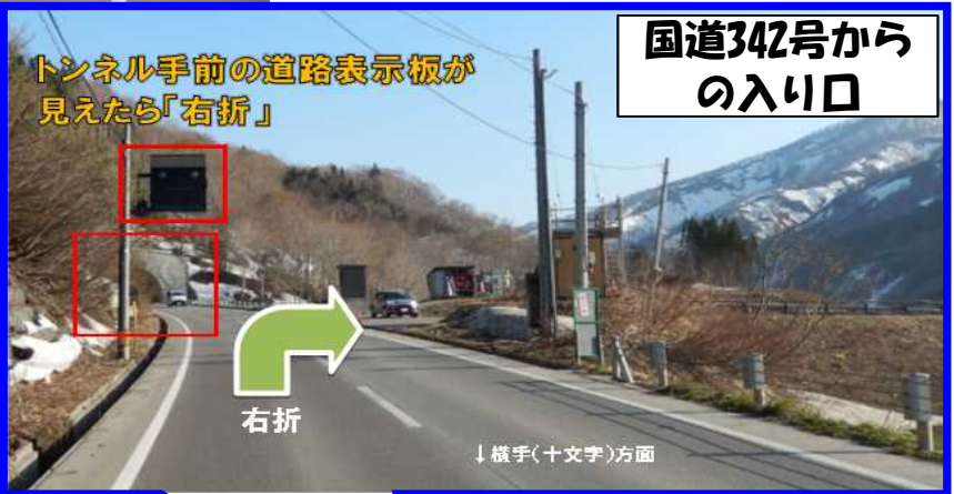
国道342号からの入り口