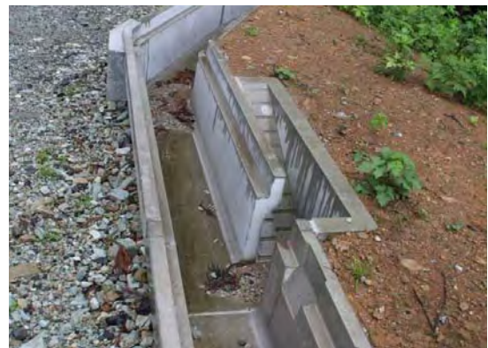
図 3.2-2 小動物用脱出スロープ