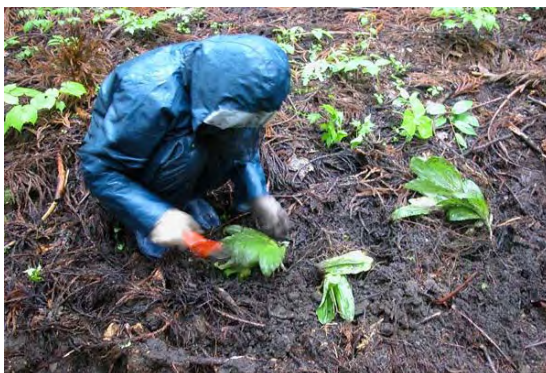
図 3.2-3 重要種の移植