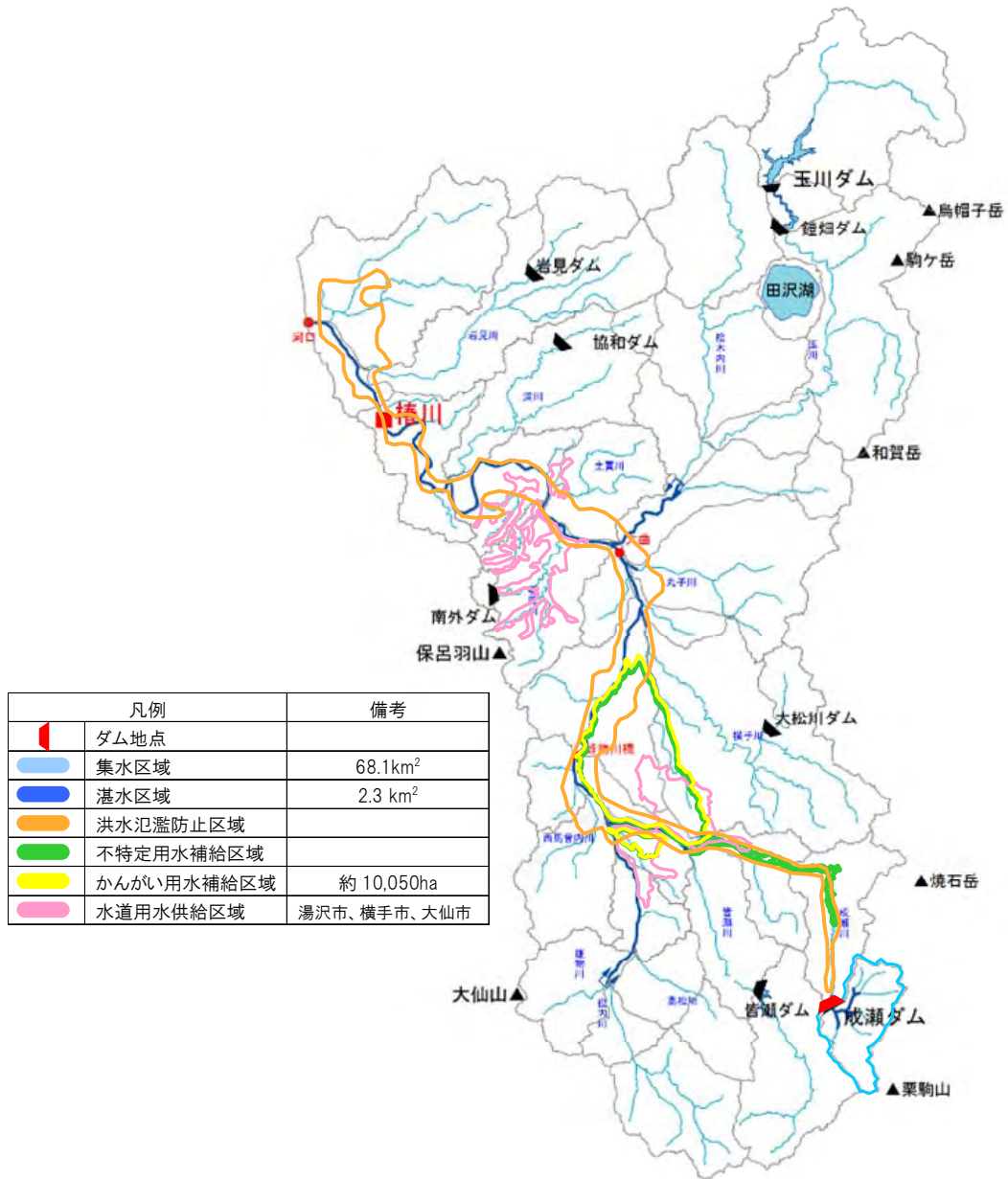
図 3.1-1 成瀬ダム計画概要図