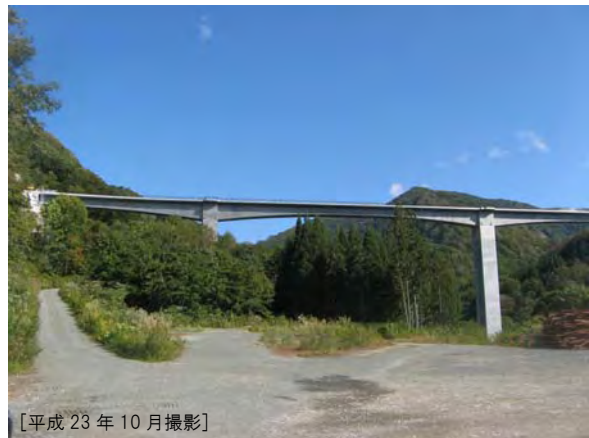
付替国道 1 号橋