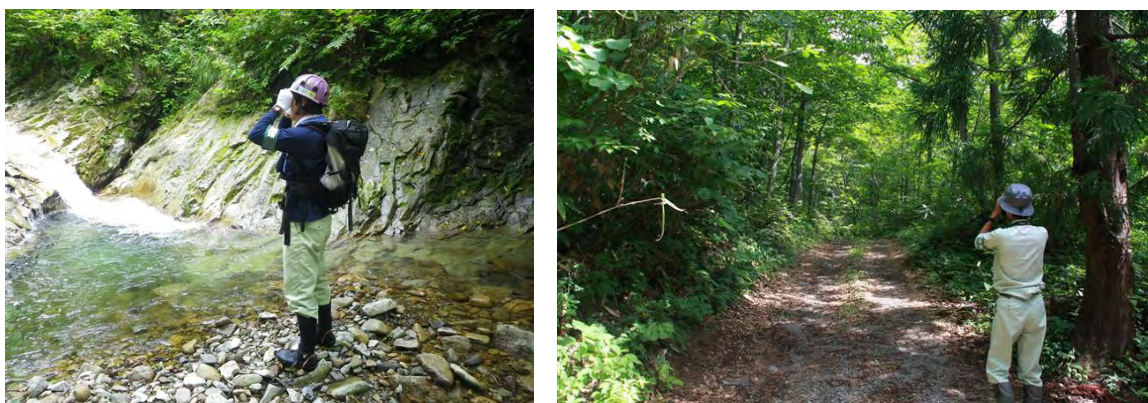
図 3.2-1 環境巡視の状況

事業による環境の変化を監視するため、事業区域内を定期的に巡視している。また、工事実施にあたっては、施工による環境への影響を確認している。