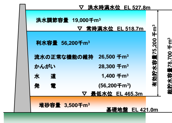
図 3.1-2 貯水池容量配分図