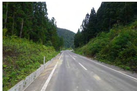
図 3.2-4 現地表土を用いた法面緑化