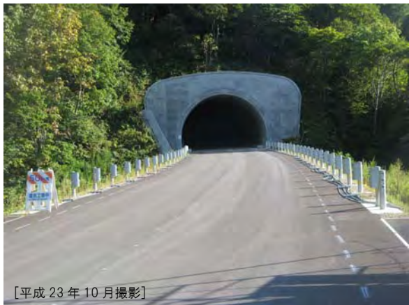
付替国道 1 号トンネル