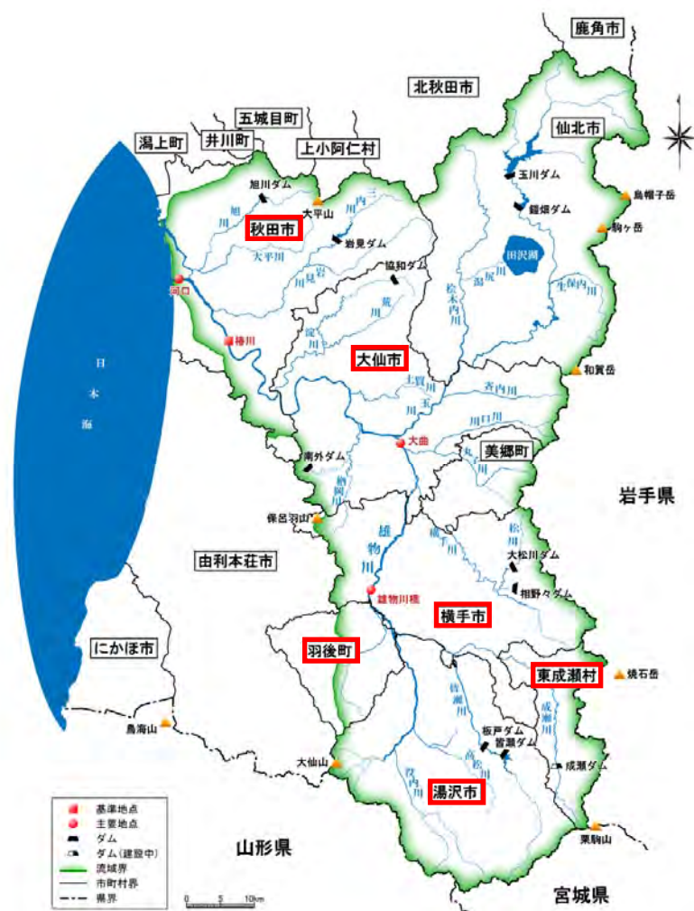
図 1.2-1 雄物川水系流域図