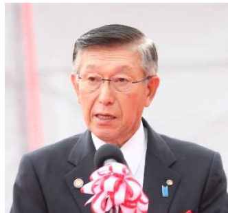
佐竹秋田県知事挨拶