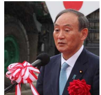
菅衆議院議員挨拶

定礎式とは、ダムの基礎が立ち上がったことを記念するとともに、本格的な工事にあたり礎石(そせき)を添えてダムの永久堅固と安泰を願うもので、ダム建設工事の中で最も重要な行事とされています。