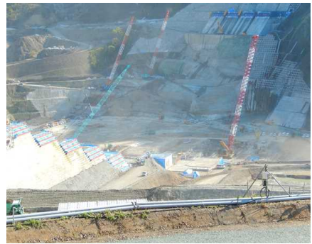
右岸展望台からの眺め