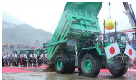
無人重機によるCSG投入

その後、自動化運転の無人大型ダンプトラックで運ばれたCSGを投入し、自動化運転の無人ブルドーザーの敷き均しにより礎石などがダムへ埋められると、会場からは大きな歓声が上がりました。