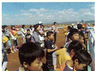
(皆瀬頭首工現場見学状況)