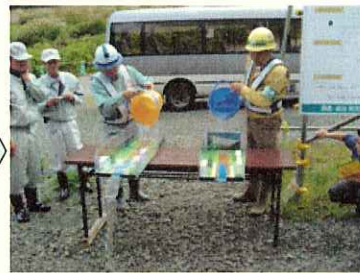
(ダムの働きを模型で実演)