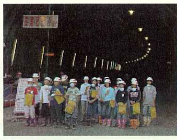
(1号トンネル現場見学 坑口前)