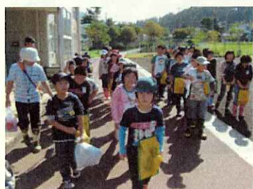
(東成瀬小学校出発 (行ってきま〜す))

水源地である東成瀬小学校の4年生及び6年生、計39名の子供達は、普段目にはできない掘削中のトンネルや、頭首工の工事現場に興味津々で、熱心に説明を聞いていました。