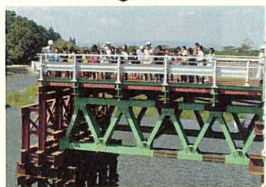
(仮栈橋上での説明)