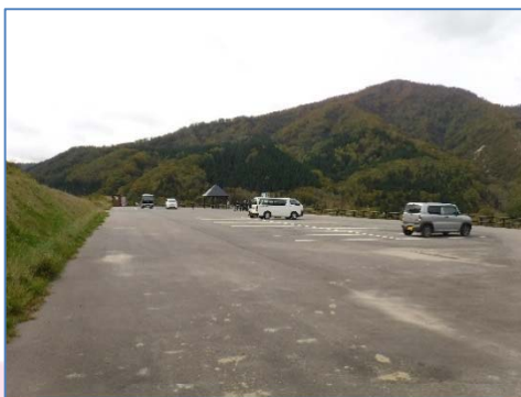
駐車場も整備されています

今年から、展望台への来場者数を把握するため、『 来場カウンター 』を設置しています。展望台に来場された際には、『 来場カウンター 』へのご協力をお願いします。