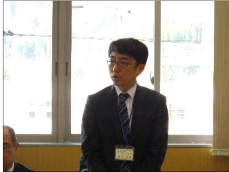
挨拶する村山事務所長