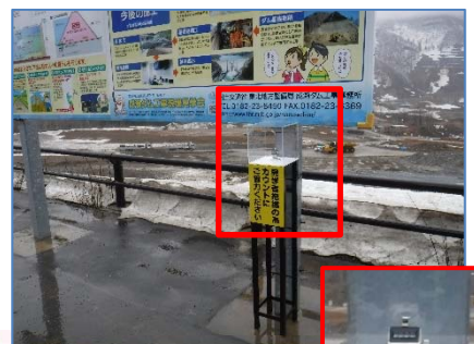
来場者の把握にご協力下さい