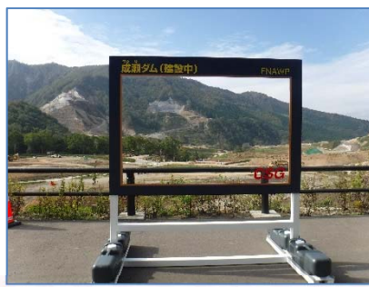
ダムカード風フォトフレームもありますよ