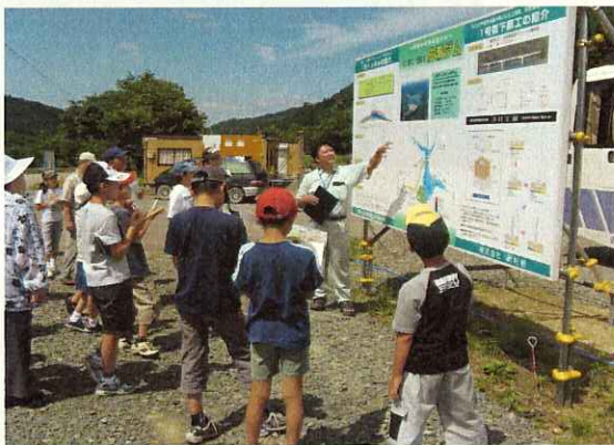
(説明を聞く豆記者たち)

小学生の児童に、学校から一歩外に出た社会や技術の最前線を感じ取ってもらおうと、「よみうり社会科見学会」が平成18年7月31日に行われ、その一環として成瀬ダムの現場を見学しました。31名の児童は、普段目にできない現場に興味津々で、メモをとる姿はさながら「新聞記者」のようでした。