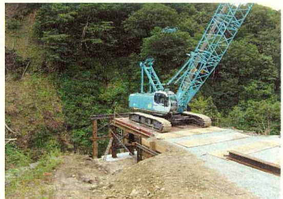
(P3への仮栈橋施工状況)