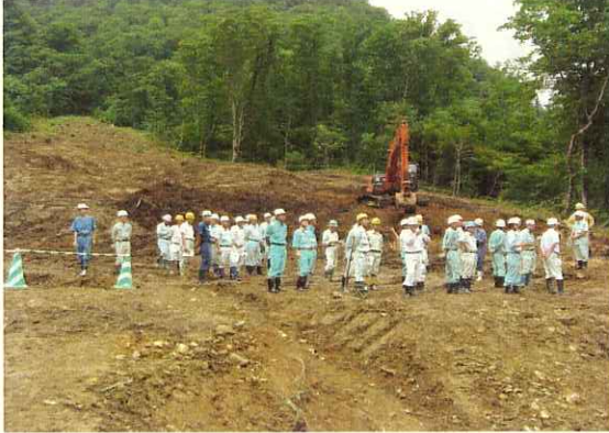
(1号橋下部工現場視察)

平成18年7月26日、県南3郡の建設業者45名による、成瀬ダム現場見学会が行われました。