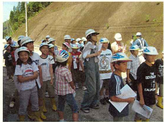
(トンネル発破を待つ様子)