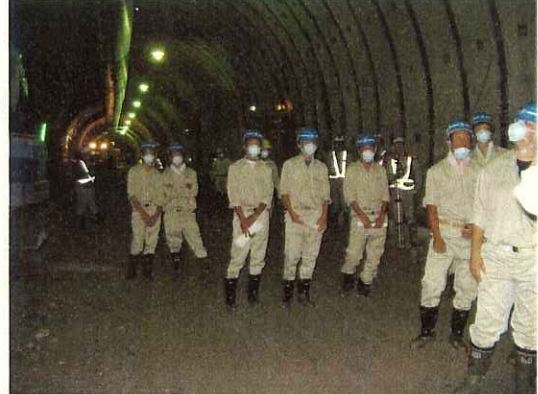
(1号トンネル現場視察)

大曲工業の生徒11名によるインターンシップが、平成18年8月2日に行われました。