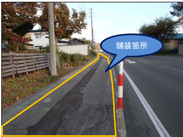
写真① 工事前の仮舗装状況(イメージ)

通行者や付近の住民の方々には大変ご迷惑をおかけしますが、ご協力をお願いいたします。