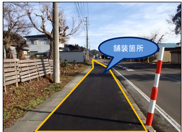
写真② 工事後の本復旧状況(イメージ)