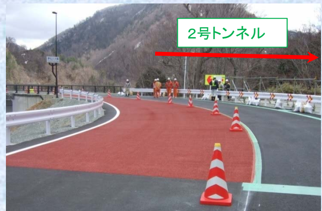
写真① 夢仙人大橋より2号トンネル側を望む