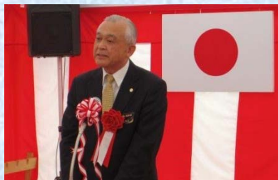
齊藤湯沢市長 祝辞