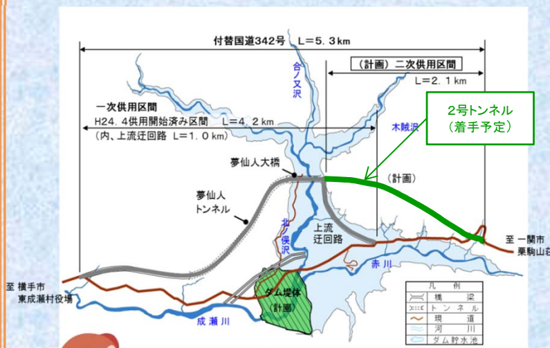
成瀬ダム計画平面図