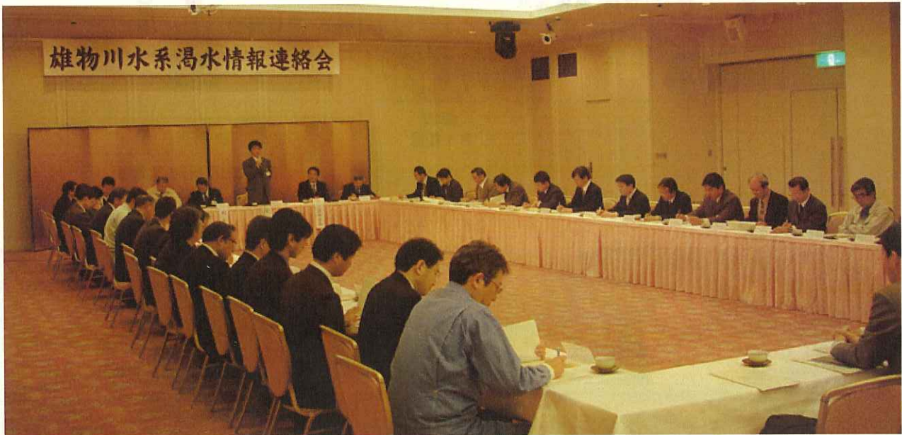
(雄物川水系渇水情報連絡会 開催状況)

今後の降水量にもよりますが、水不足に対する心構えも参加者一同認識し、関係機関のより一層の連携を深めていきたいと考えております。