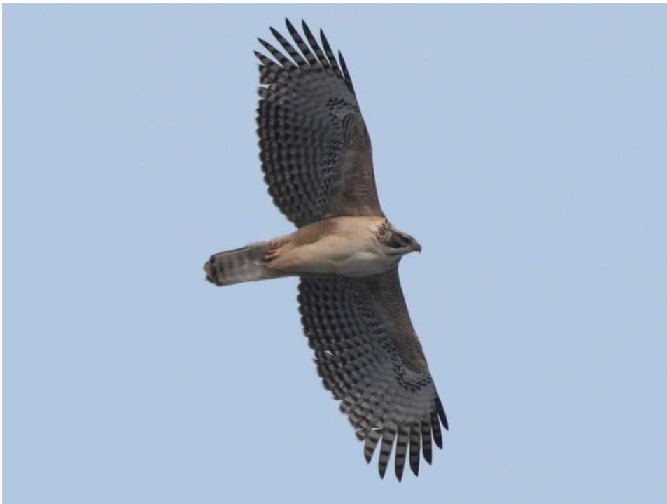
写真4 クマタカbペアの幼鳥(令和5年生まれ) (令和6年3月19日撮影)