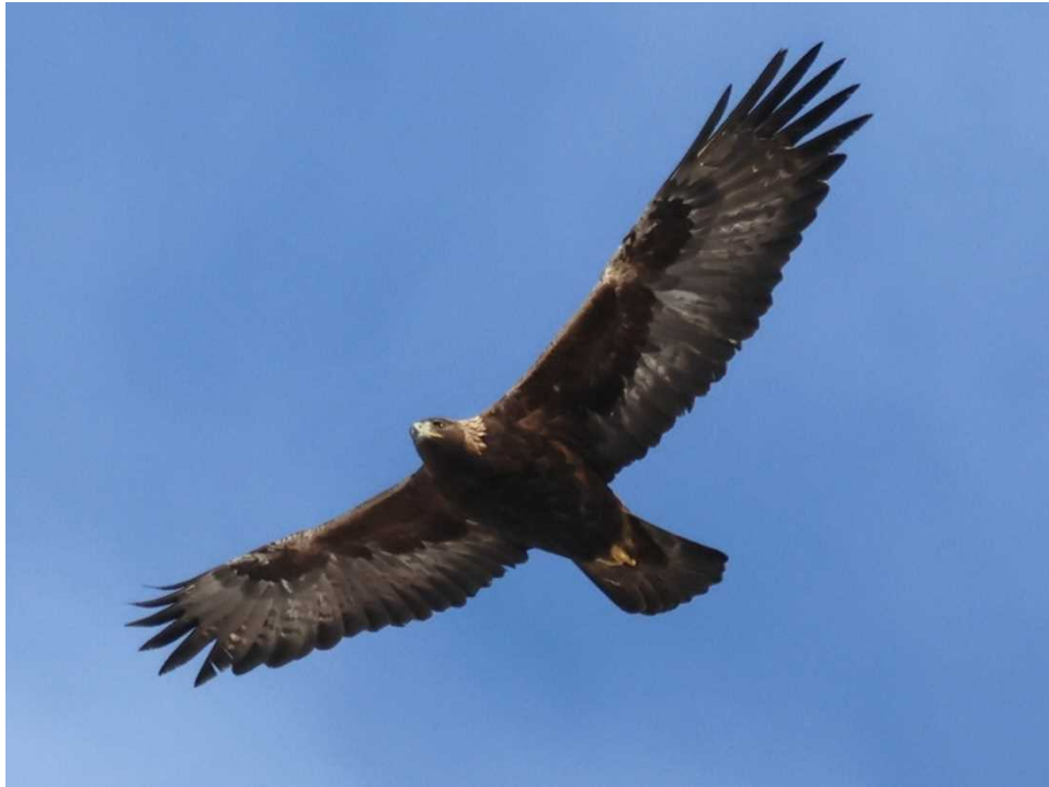
写真1 イヌワシペア成鳥♂個体 (令和6年1月9日撮影)