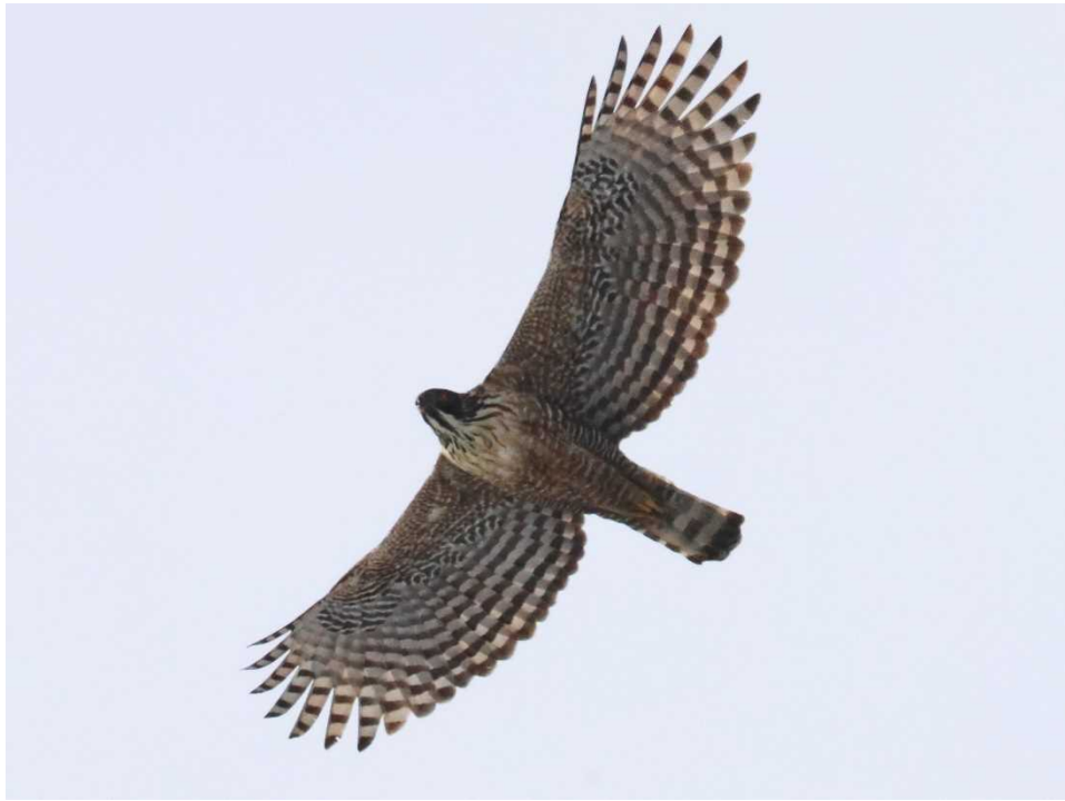
写真3 クマタカbペア成鳥♀個体 (令和5年10月10日撮影)