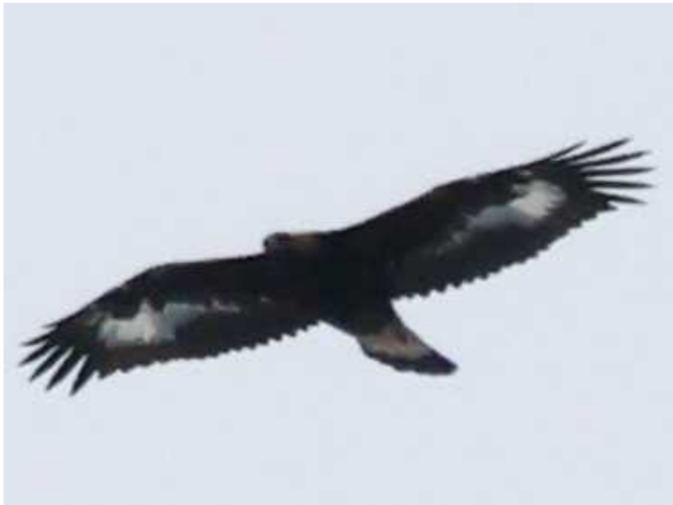
写真2 イヌワシペアの幼鳥 (令和5年生まれ) (令和6年1月9日撮影)