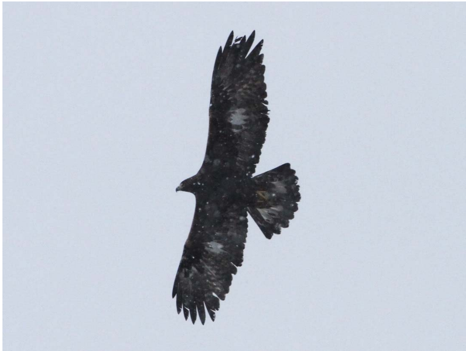
写真1 イヌワシ不明ペア♂個体 (平成30年12月20日撮影)