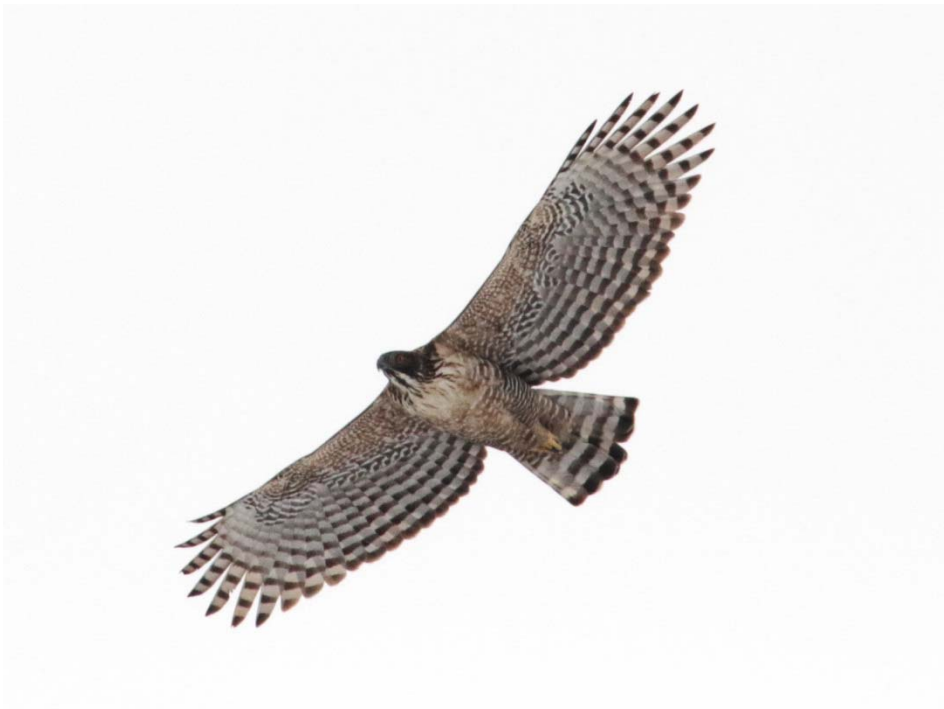
写真2 クマタカbペア♀個体 (平成31年2月22日撮影)