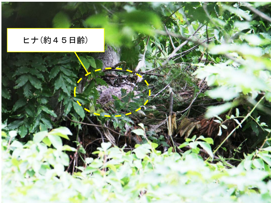
写真2 クマタカcペアの巣 (平成30年7月8日撮影)