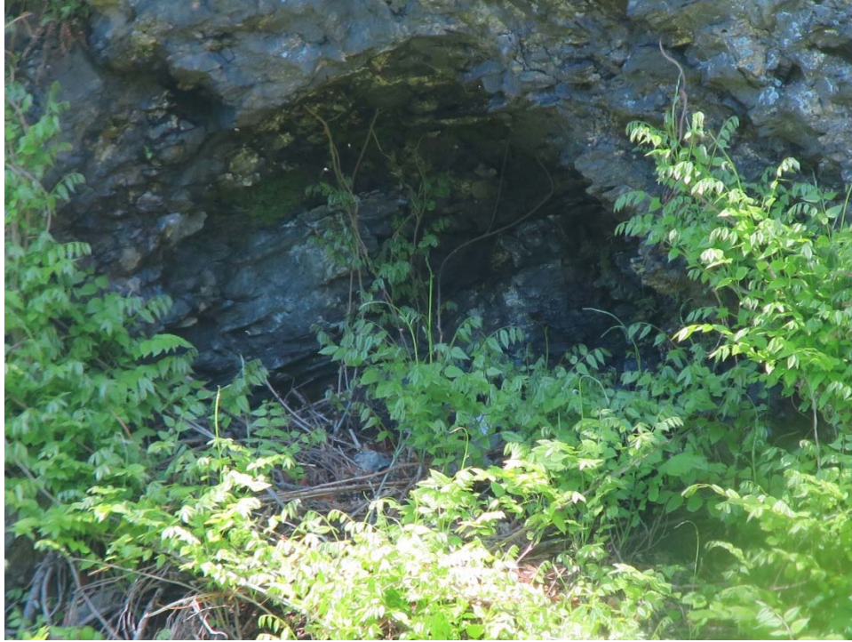
写真1 イヌワシの巣 (平成30年5月20日撮影)