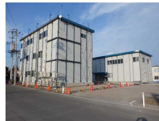
事務所 (右側の建物)