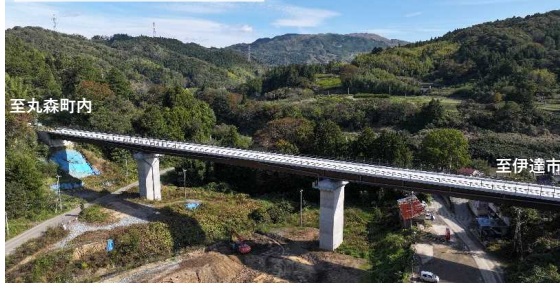
現在の状況(令和6年10月撮影)

長さ 190m 位置 丸森町耕野字登花東～耕野字高原 地内 交差 内城沢川、県道川前白石線、町道川前線