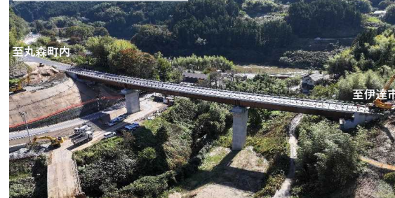
現在の状況(令和6年10月撮影)

長さ 130m 位置 丸森町耕野字火石坂～耕野字沼 地内 交差 芦沢川、町道八巻矢城線