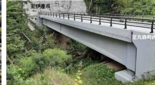
現在の状況(令和6年8月撮影)