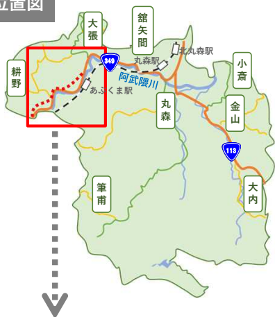
空撮写真(福島県側から撮影)