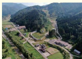
南砺市利賀村の土砂流出対策

【本宮堰堤】常願寺川中流部に施工された、日本最大級の貯砂量を誇る基幹砂防堰堤。平成29年に国の重要文化財に指定。