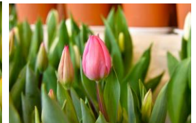
ライトピンクプリンス ピンクの一重咲き トライアンフ

※チューリップのほかパンジー（2品種）ビオラ（4品種）シクラメン（3品種）ポインセチア、ハボタン、プリムラ、ランタンキュラス（各1品種）などで花壇を彩っています