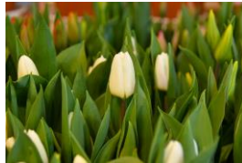
ホワイトプリンス 白の一重咲き トライアンフ