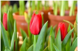
レッドラベル 赤の一重咲き トライアンフ