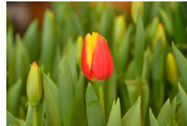
ダウジョーンズ 赤黄の一重咲き トライアンフ