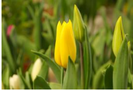
ストロングゴールド 黄色の一重咲き トライアンフ