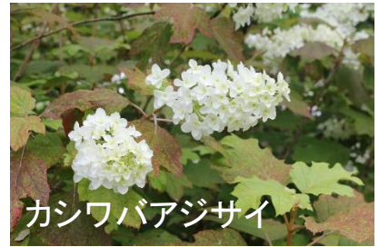
カシワバアジサイ