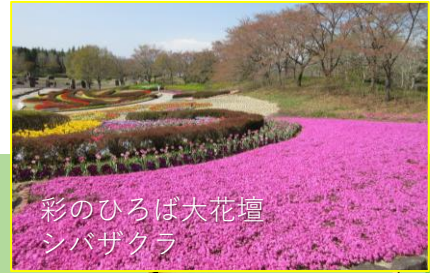
彩のひろば大花壇 シバザクラ