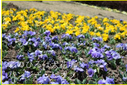
彩のひろば大花壇 パンジー・ビオラ