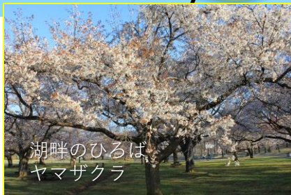
湖畔のひろば ヤマザクラ