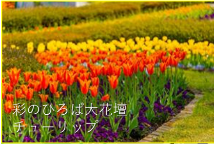
彩のひろば大花壇 チューリップ