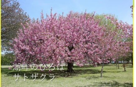
湖畔のひろば サトザクラ