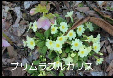
プリムラブルガリス