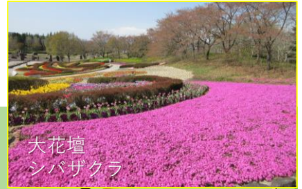
大花壇 シバザクラ