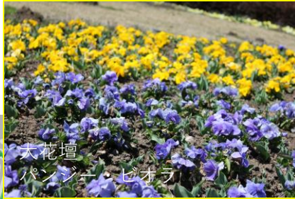
大花壇 パンジー・ビオラ