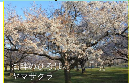
湖畔のひろば ヤマザクラ