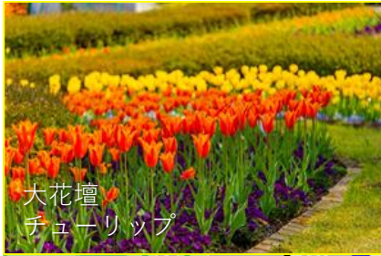
大花壇 チューリップ