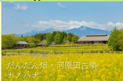
だんだん畑・河原田古墳 ナノハナ