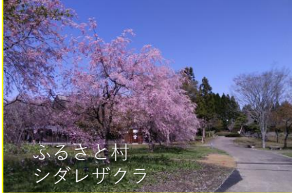
ふるさと村 シダレザクラ