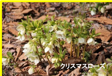
クリスマスローズ

小さな草花たちで春を感じてみてはいかがでしょうか？たくさんのご来園をおまちしています。