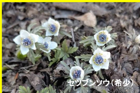
セツブンソウ(希少)