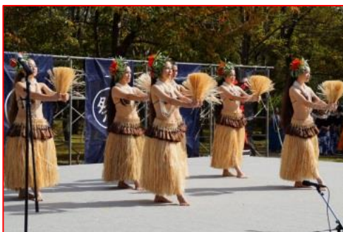
10/14 フラ&タヒチアダンス