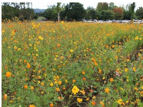
<キバナコスモス「ブライトライト」>

花畑のコスモスは、キバナコスモスの見頃が9月下旬～、センセーション系コスモスは台風24号の影響を受けて若干生育不良になってしまいましたが、何とか最後までご覧いただけました。だんだん畑のコキアは、10月中旬から紅葉が始まり、下旬には見頃となりました。