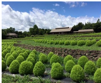
<コキア〔ほうき草〕（緑葉期）>