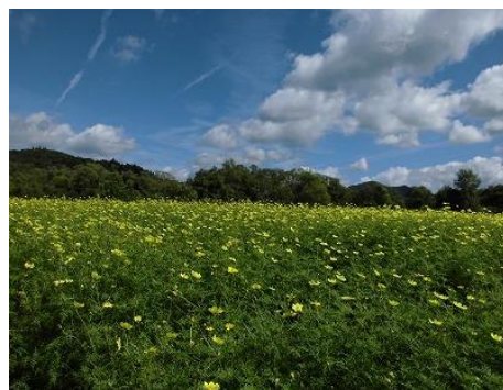
<キバナコスモス「レモンライト」>