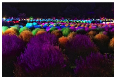
「コキアカリ」会場（昨年）