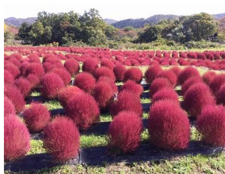
<コキア〔ほうき草〕（紅葉期）>