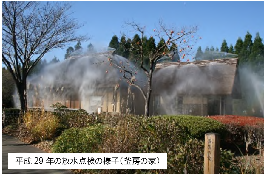
平成 29 年の放水点検の様子(釜房の家)