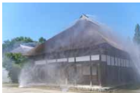
平成 24 年の放水点検の様子