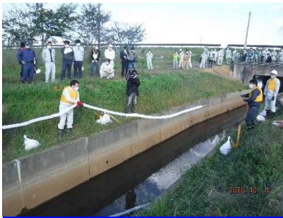
参加者によるオイルフェンス設置状況

水路や小河川での油回収に有効な吸着マット型オイルフェンスを使用した設置訓練を自治体職員と消防署員による2班で行いました。