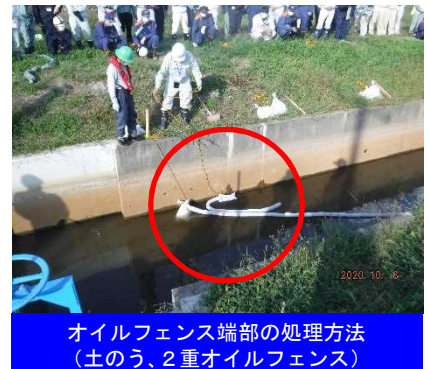
オイルフェンス端部の処理方法 (土のう、2重オイルフェンス)