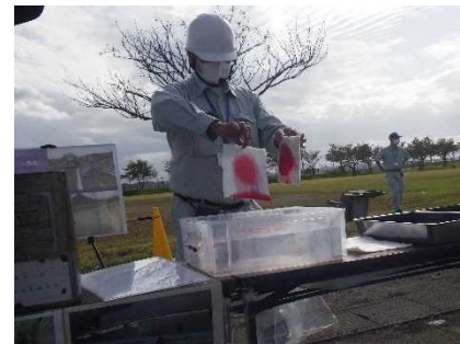
吸着マット性能の違いの実演