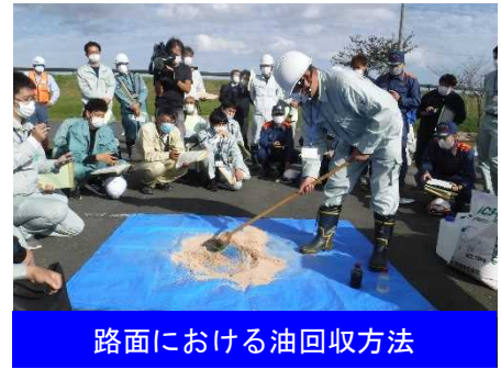
路面における油回収方法

・路面に流れた油(1リットル)は、吸着資材等により比較的容易に回収できるが、川に流れた1リットルは、サッカーコート1面分にもなる。 ・陸上で起こった油漏れは水域に流さない。 路肩の土やおがくず、砂など何でもいので側溝に流れる前に油を止めることが大事である。