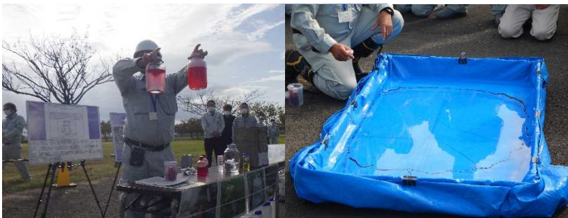
油処理に中和剤を使用した実演

中和剤を使用した油処理の実演により、油が分散しているだけで処理されていないこと、油の入った水槽に吸着マット・活性炭を投入し、油の吸着性能の違いについて講習しました。