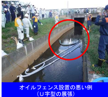
オイルフェンス設置の悪い例 (U字型の展開)