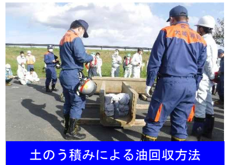
土のう積みによる油回収方法

・オーバーフローしないように塩ビ管(直角エルボ)を用いて、油の下の水を下流に流す。 ・土のう積みは、間隔を開けて3箇所を設置すると良い。