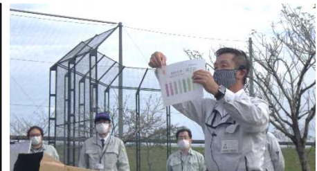
パックテスト使用方法の説明