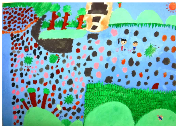
江合川及び鳴瀬川水系 【図画・特選】