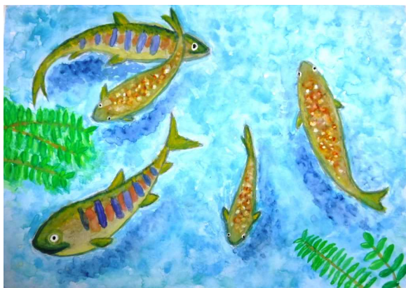
北上川水系 【図画・特選】

※令和2年度は、新型コロナウイルス感染症の影響に配慮して児童図画コンクールは中止しました。