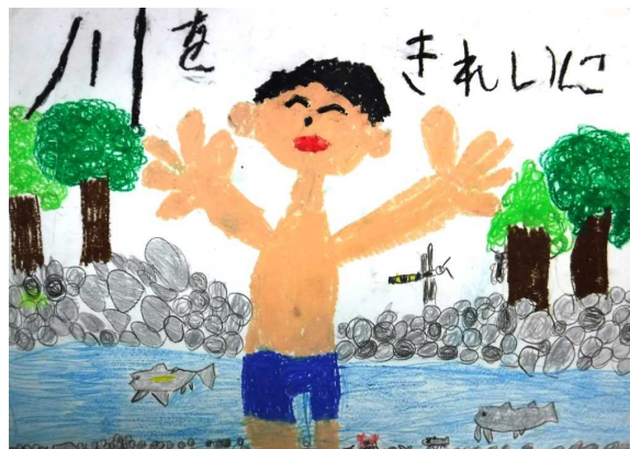
江合川及び鳴瀬川水系 【ポスター・特選】