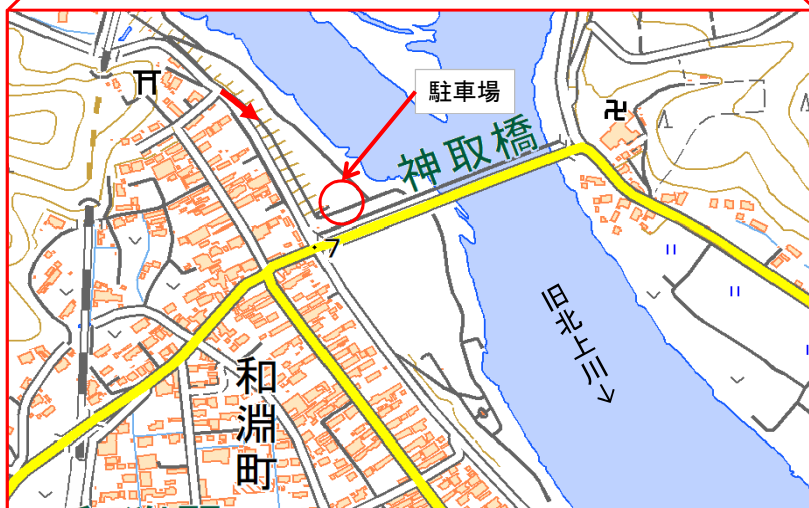
この地図は、国土地理院長の承認を得て、同院発行の電子地図(タイル)を複製したものである。 (承認番号 平30東複、第23号)