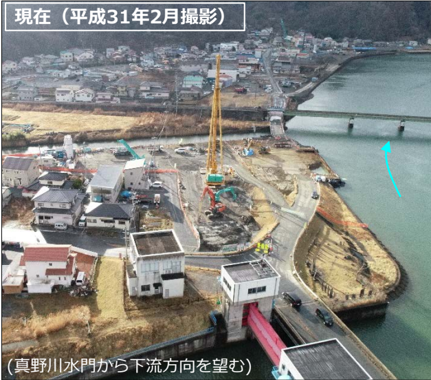
（真野川水門から下流方向を望む）