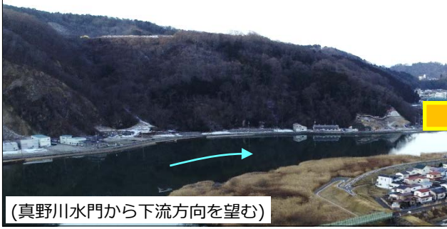
（真野川水門から下流方向を望む）