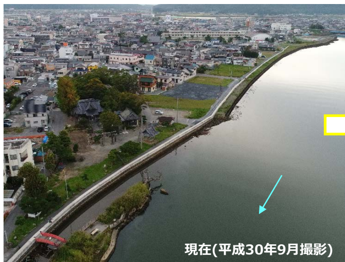
現在(平成30年9月撮影)