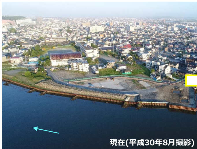
現在(平成30年8月撮影)