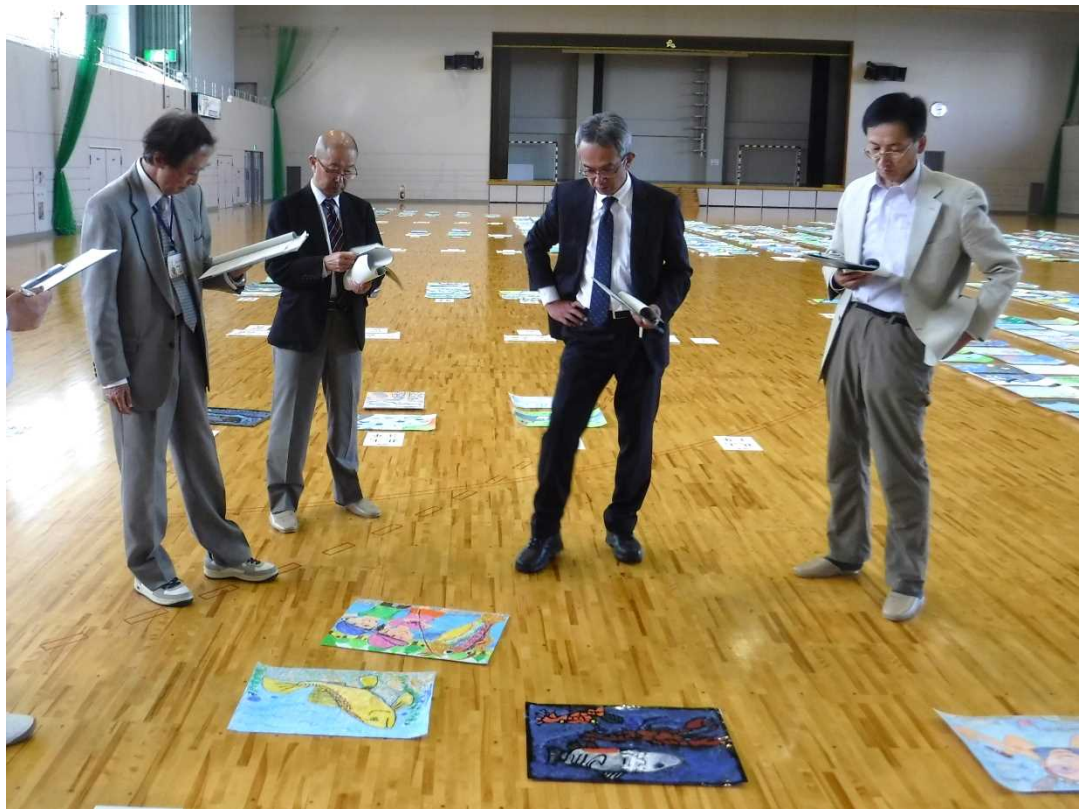
平成30年度 児童図画審査状況（平成30年10月12日 大崎市田尻総合体育館）