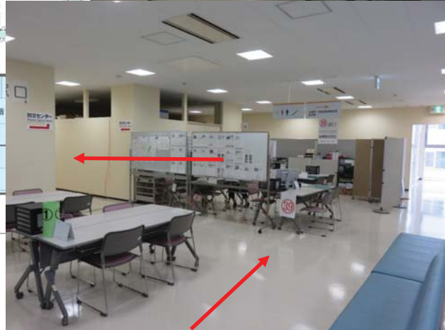
第6回旧北上川河口かわまちづくり検討会 庁舎案内図