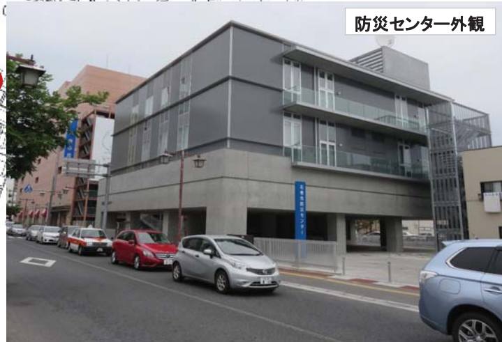
第6回旧北上川河口かわまちづくり検討会 会場位置図