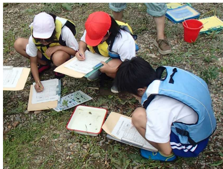
水生生物による水質判定