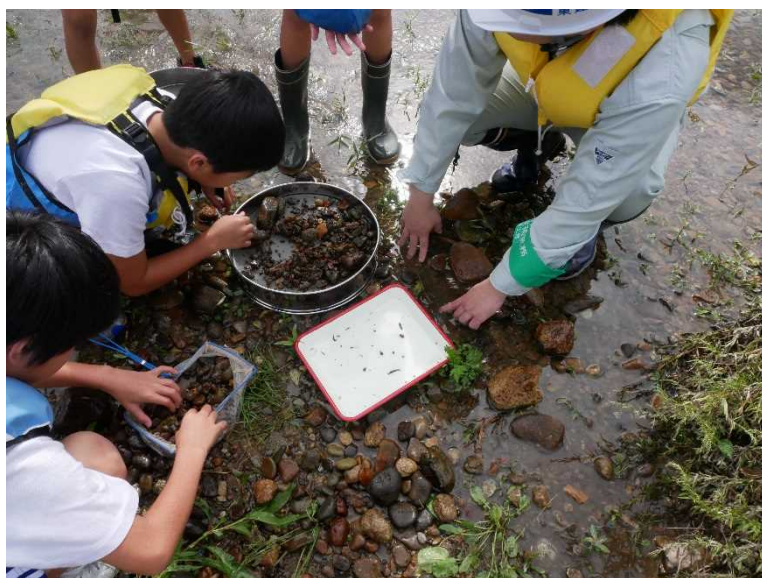
水生生物による水質判定