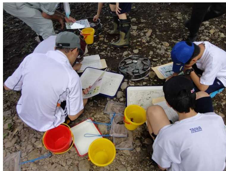
水生生物による水質判定