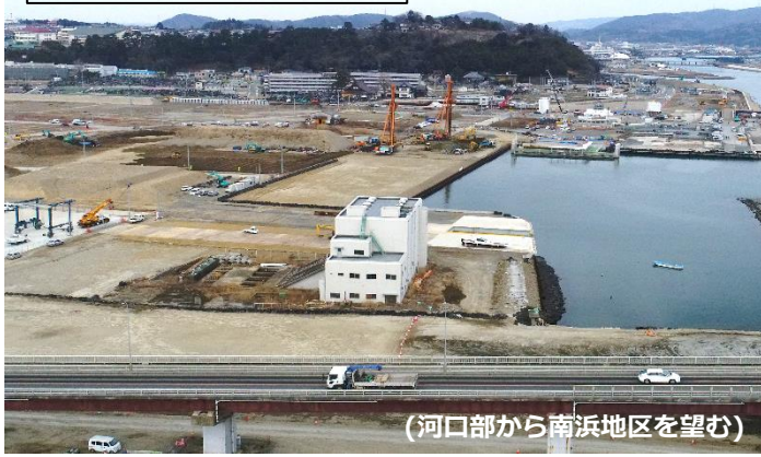
（河口部から南浜地区を望む）