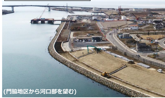
（門脇地区から河口部を望む）