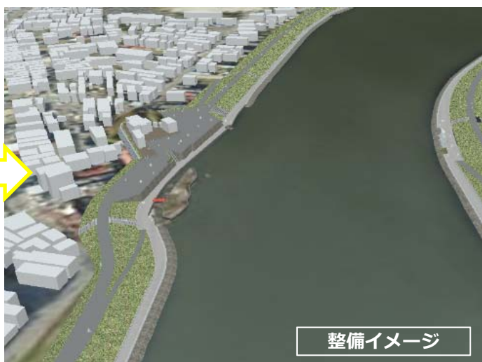
(内海橋上空より旧北上川の上流を望む)