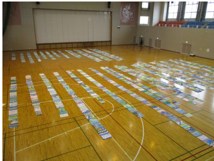
(参考)平成28年度 児童図画審査状況(平成28年10月5日、鎌田記念ホール)