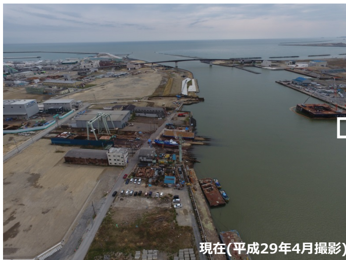
現在(平成29年4月撮影)