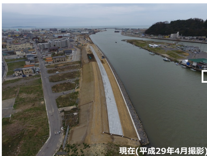
現在(平成29年4月撮影)