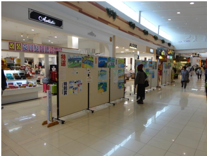
H28児童図画入選作品展示状況(イオンタウン佐沼店:H28.10.17~10.23)