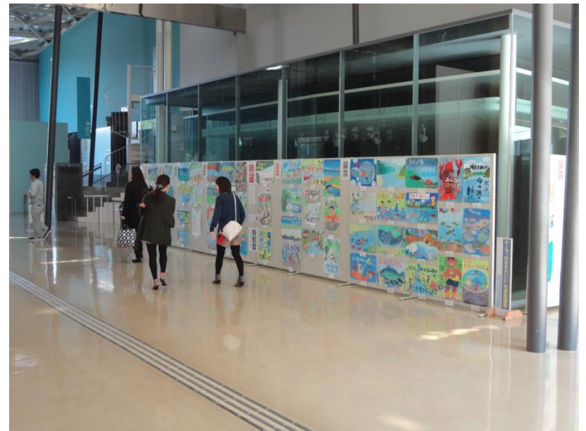
H28児童図画入選作品展示状況(遊学館:H28.10.25~10.30)