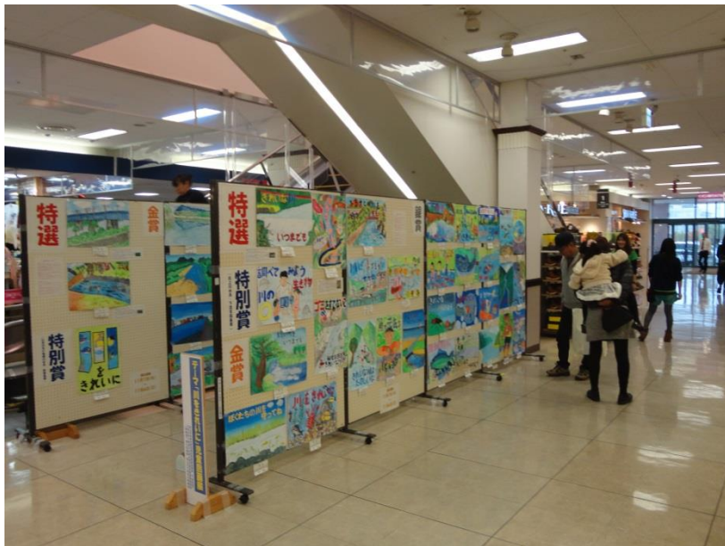
H28児童図画入選作品展示状況(イオン古川店:H28.11.1~11.6)