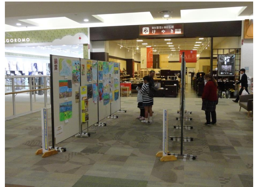
H28児童図画入選作品展示状況(イオンモール石巻店:H28.11.8~11.14)