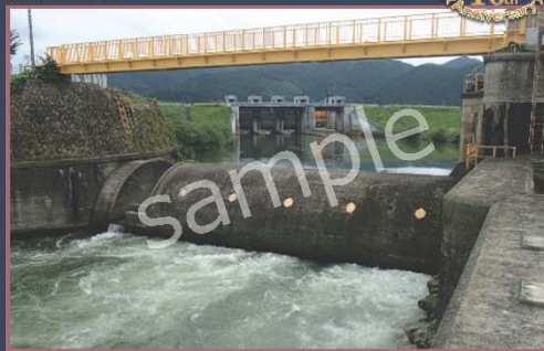
わき や あらいばき 脇谷洗堰