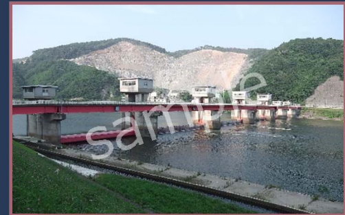
きた かみ おの せき 北上大堰