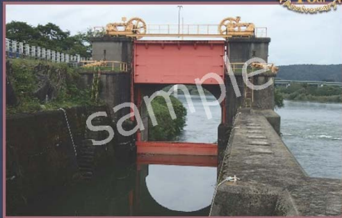
わき や ごう ちん 脇谷閘門