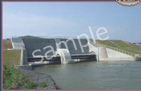
とき なみ すい ちん 鶺波水門