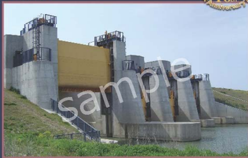
わき や すい ちん 脇谷水門