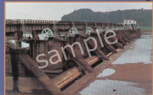
いひ の おの か どう せき 飯野川可動堰