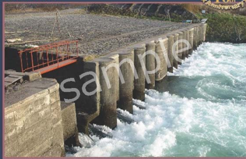
とき なみ あらいばき 鶺波洗堰