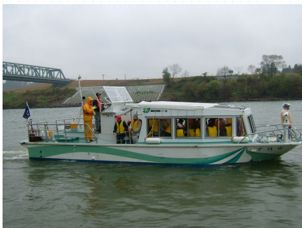
「ゆはず号」(岩手河川国道事務所)