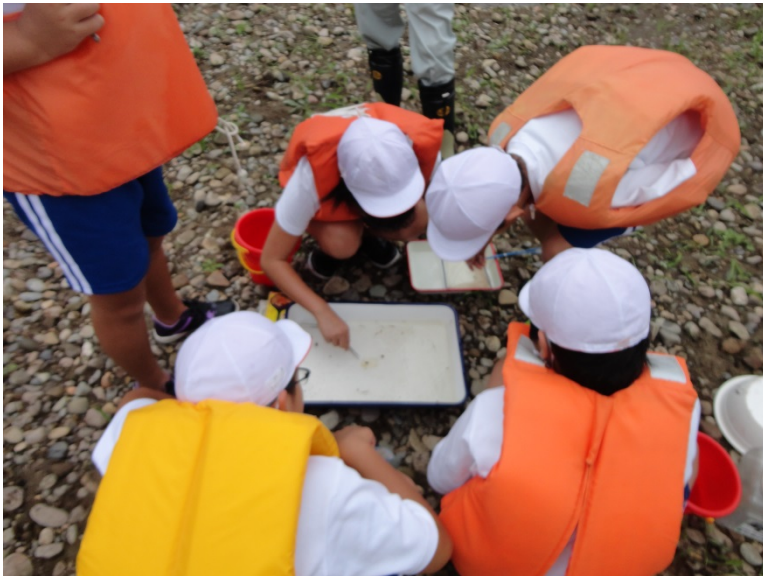
水生生物による水質判定