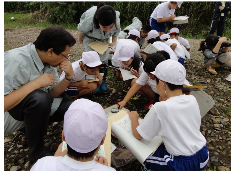
水生生物による水質判定