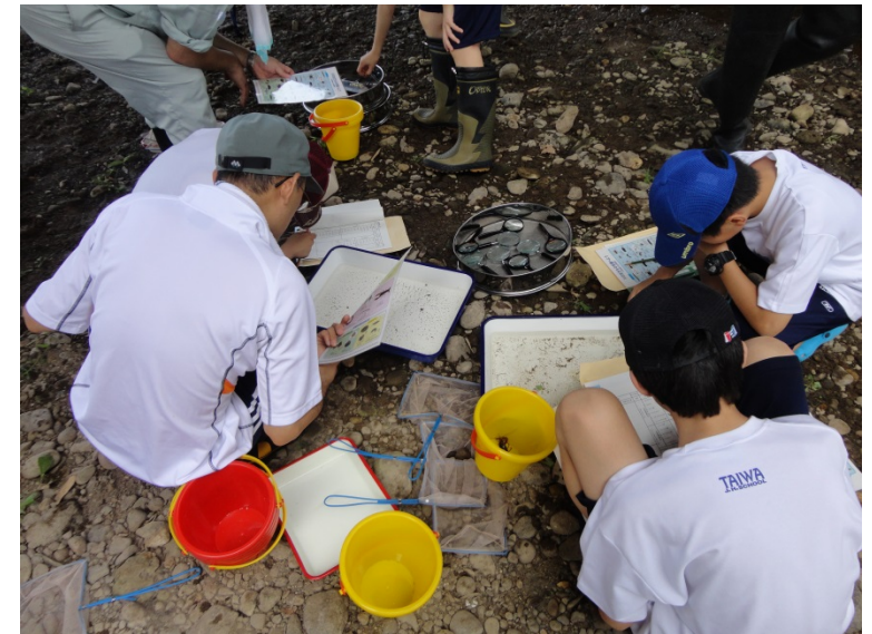
水生生物による水質判定