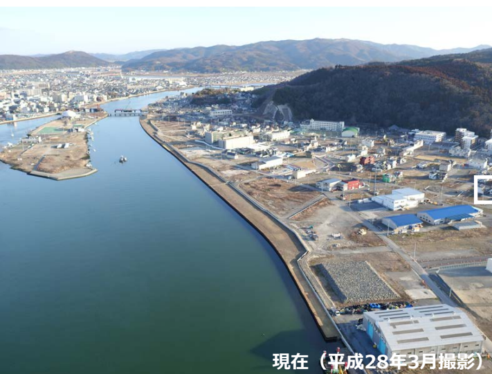
現在（平成28年3月撮影）