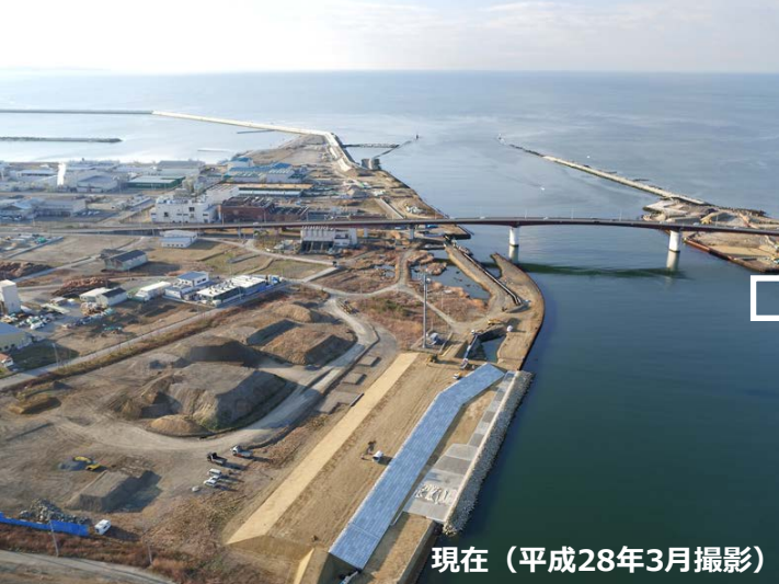
現在（平成28年3月撮影）