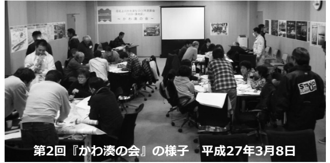
第2回『かわ湊の会』の様子 平成27年3月8日

今回は、それらを踏まえた整備内容と事業の進捗等につきまして、ご報告させていただくとともに、新たに生まれる河川空間に関する意見交換を行いたいと考えております。